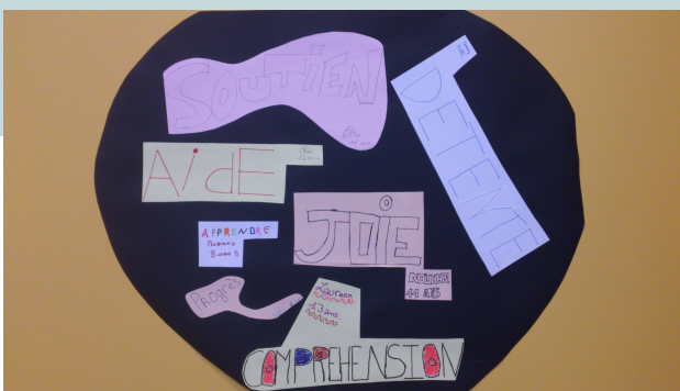
Tableau sur lequel sont affichés les propos tenus par les jeunes sur leurs représentations du soutien scolaire.

Les interventions des éducatrices scolaires se font au Service, à domicile, ou encore au sein des institutions scolaires, écoles primaires ou collèges - un travail autour des conventions SSE 94 / Education nationale est en cours. Des travaux de groupe sont constitués et proposés selon les niveaux, et se dé-