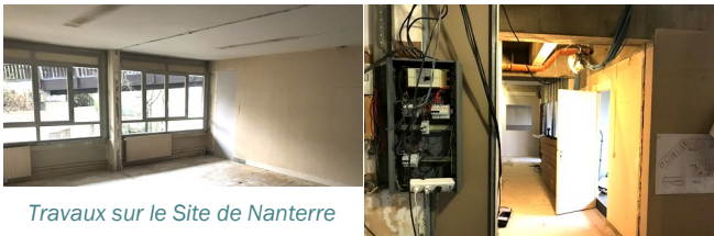
Travaux sur le Site de Nanterre

La réhabilitation complète du site de Nanterre du SSE 92 est en cours. Les travaux permettront au personnel et au public d'être accueillis dans des conditions modernes, confortables et mieux adaptées à nos missions d'aujourd'hui et aux défis de l'avenir. Nous avons pu compter avec le soutien important du Département des Hauts-de-Seine et de la Protection Judiciaire de la Jeunesse, cette dernière mettant à disposition à titre gracieux des locaux pour notre SIE pendant une année. Pour ce faire, le Service a dû déménager l'ensemble du