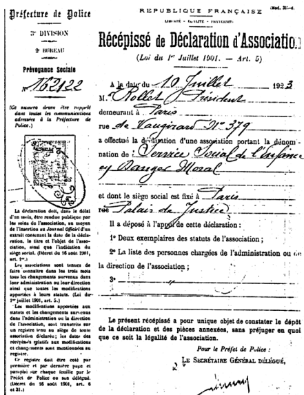
Récépissé de déclaration du SSEDM le 10 juillet 1923

Les enfants objets de plaintes de leurs parents au titre de la correction paternelle. Les enfants maltraités dont les parents sont menacés du retrait de la puissance paternelle ou du droit de garde. Les délinquants de 13 ans.